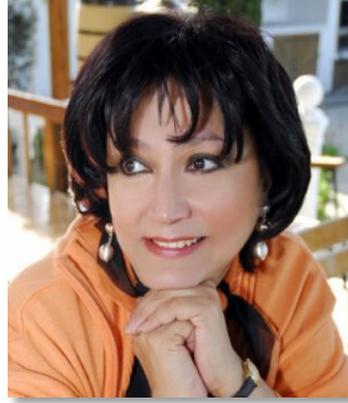
Foto 1. Azərbaycan Respublikasının Xalq artisti, professor Xuraman Qasımova

X. Qasımova Türkiyə'ye devət olunmuş və İstanbul Universitetinin nezdində olan konservatoriyada 1997-ci ilə qədər pedaqoji fealiyyətlə məşğul olmuşdur. Burada fealiyyət göstərdiyi illərdə Xuraman xanım pedaqoji fealiyyətlə yanaşı, Türkiyə'nin bir çox şəhərlərində, o cümlədən İstanbul və Ankarada konsertlər vermişdir. X.Qasımova həmçinin italyan bestekarı C.Verdinin "Aida" operasında Aida partiyasını türk opera ifaçıları ilə birlikdə ifa etmişdir. X.Qasımova Türkiyədə vokal ifaçılıq enələrini formalaşdırmış və gənc vokal ifaçıların müstəqil şəkildə fealiyyət göstərməsində öz dəstəyini göstərmişdir.