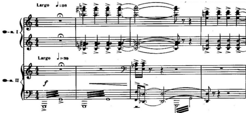
Figür 1. “Azerbaycan” oratoryosundan I. bölüm

Bu bölümün başındaki enstrümantal giriş, akor yapısına sahip bir faktürel yapı ile ilk bölümlerde dolgun seslenişi ile görkemli Vatan imajının tasvirine hizmet etmektedir.